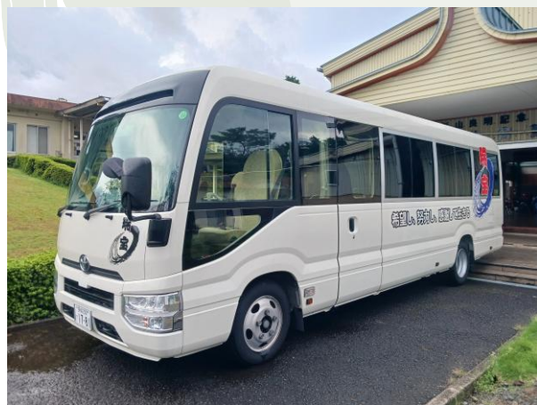
マイクロバス 「長さ7.8m、幅2m、高さ2.7m」