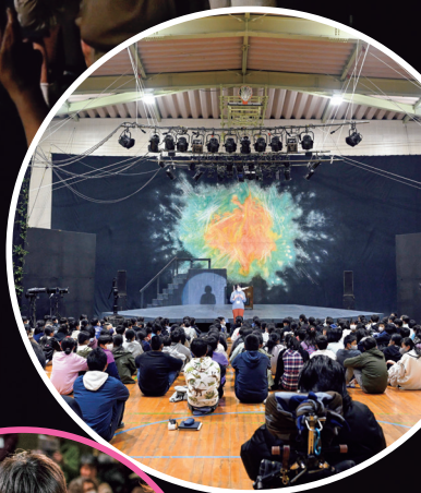
みんなの体育館に バリアフリーな ヘレン・ケラーの世界が 広がります