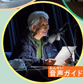
音声ガイドナレーター