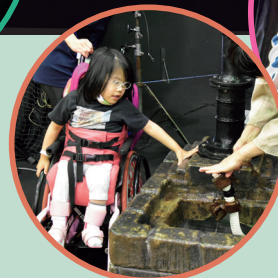
ふれて感じる バックステージツアー