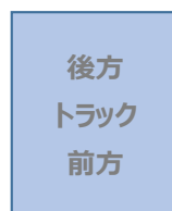
後方 トラック 前方