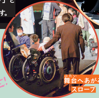
舞台へあがる スロープ