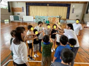
図1) マイムを使ったシアターゲームを取り入れることで共演時の演技の向上に努めています。