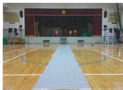
(図1・2)舞台の設置状態。

体育館のステージにて舞台を組みます。 舞台設置に必要な面積 横:7.2m以上 奥行:3.6m以上 客席の真ん中に花道をつくります。