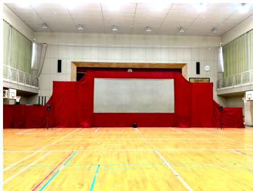
(図1) 体育館にスクリーンを設置した状態

公演に係るビジュアルイメージ (舞台の規模や演出がわかる写真) ※採択決定後、図面等の提出をお願いします。