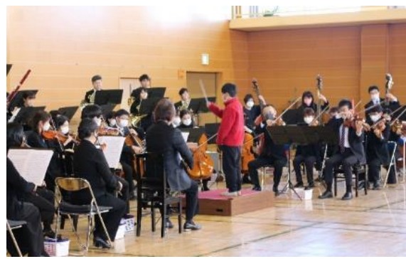
児童による指揮体験