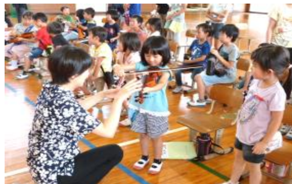
ワークショップ：楽器体験