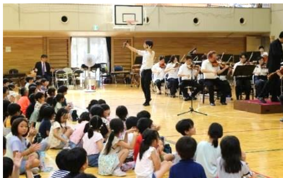
体全体で音楽を体験