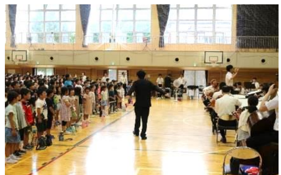
みんなで歌おうコーナー