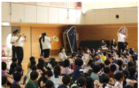
音楽なぞなぞ遊び