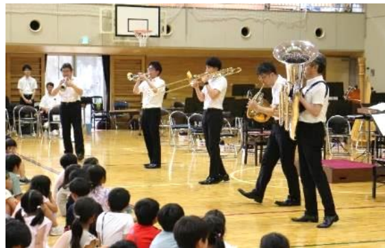
楽器紹介 (金管楽器)